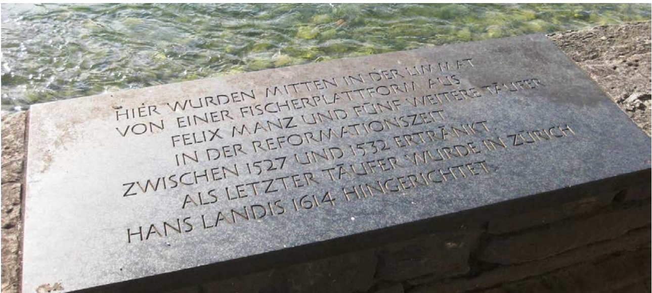
Gedenkstein an der Limmat linkes Ufer/ Schipfe in Zürich

Als Bund Schweizer Baptistengemeinden haben wir daher die einmalige Chance, die weltweite Baptistische Familie in Zürich willkommen zu heissen und das Gathering mit allen uns möglichen Kräften zu unterstützen.