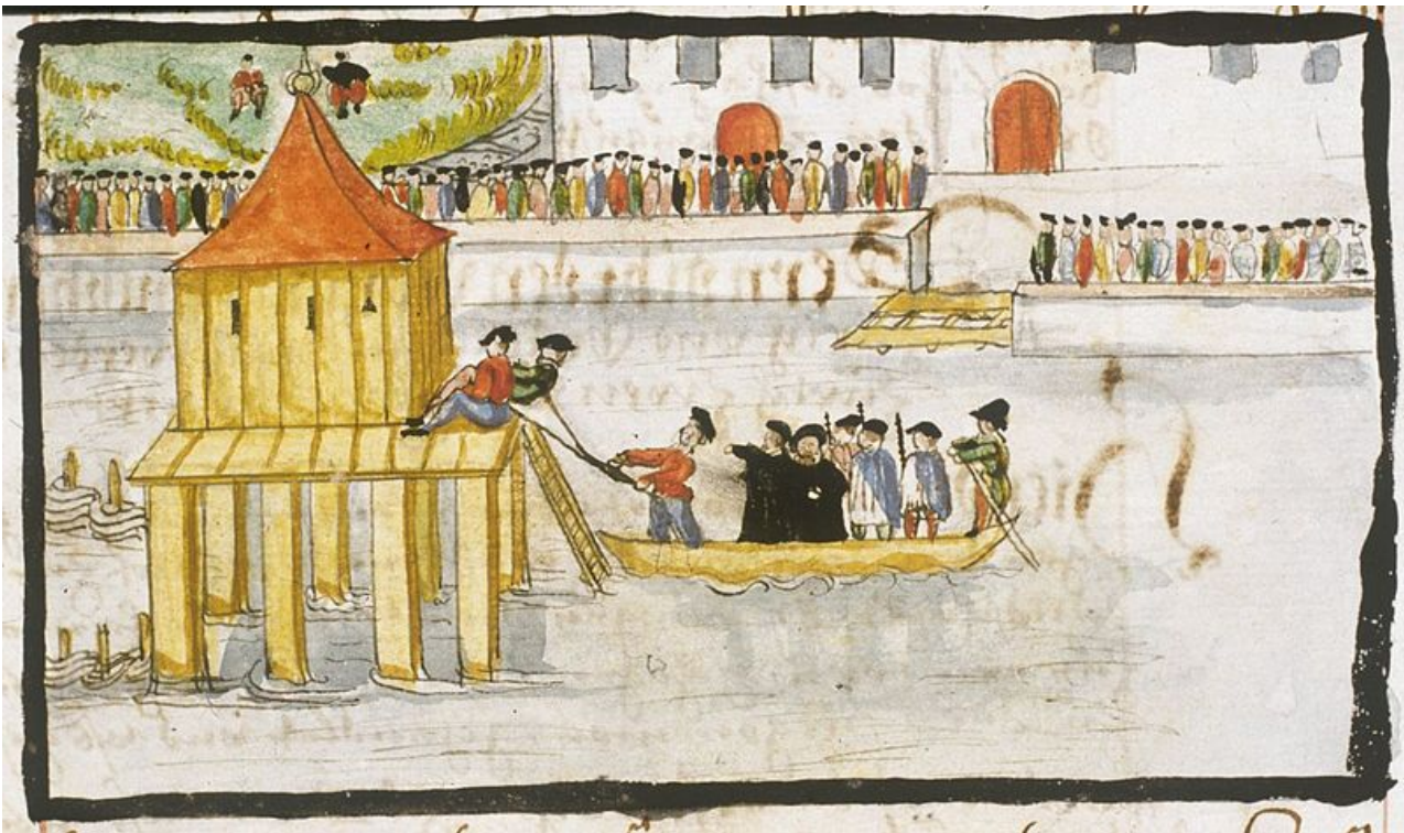
Ertränkung von Felix Manz in der Limmat. Darstellung aus dem 17. Jh.

Die Schweiz hat als Geburtsstätte des Anabaptismus einen speziellen Status in den Baptistenbünden auf der ganzen Welt. Für viele Delegierte wird es eine einmalige Gelegenheit sein, in die Schweiz zu reisen und historische Orte, an denen die Anabaptisten gewirkt haben, zu besuchen.